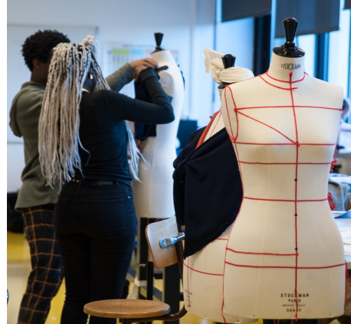
ADMA 2020 par @Matthieu Gauchet et @Lucy Winkelmann